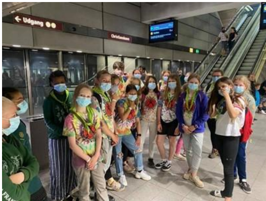
Havnar KFUK skótar - ferð til Forlev Spejdercenter

Eisini umsitur FUR Stuðulsgrunn FURs, har talan somuleiðis er um fyrisiting og um starvsstjórnaravgerðir. FUR fyrirskar somuleiðis fyrispurningar og tilmæli í sambandi við limaupptøku og mógulig tilmæli um eksklusión.