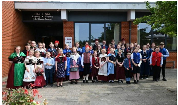
Ung í dansi - Dansiferð til Brønderslev

Tey, sum fáa stuðul úr Stuðulsgrunni FURs, hava skyldu til at lata FUR skrivliga frásøgn frá tí stuðlaðu verkætlanini í seinasta lagi 3 mánaðir eftir, at hon er framd. Frágreiðingarnar verða lagdar á heimasíðu FURs fur.fo. Stuðul verður bert latin eina ferð til sama tiltak. Starvsstjórnin tekur støðu til umsóknirnar. Starvsstjórnin kann eisini lata vera við atveita stuðul, um eingin skikkað umsókn eftir hennara meting er komin.