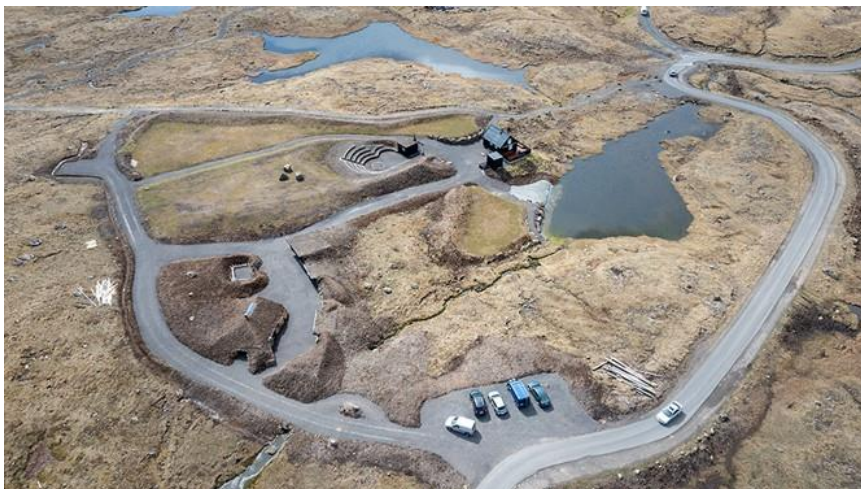
Skótadepilin hjá Skótaliði KFUMs ímillum Tjarna í Havnadali, sum var tikin í nýtslu í juli í 2021

Næmingafeløg verða ikki roknað sum lokalfeløg, men tey kunnu søkja stuðul, sum er kr. 2.000,- hvørt ár. Stuðul kann ikki verða veittur ítróttarligum endamálum.