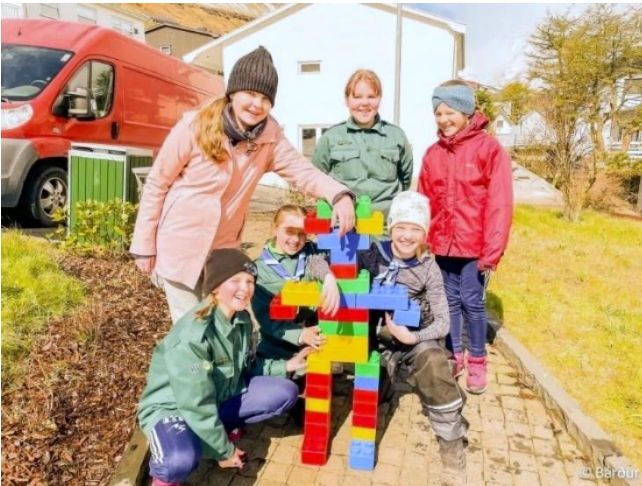
Skótalið Magnus Heinasonar, KFUK-skótarnir í Klaksvík og Skótalið Nólsoyar Pálls - smáskótadagur

Til endamálið hevur FUR gjørt eitt einfalt umsóknarskjal. Spurt verður, um endamálið við lýsingini, og um dagfesting, nær lýsingin skal takast av. Eisini verður biðið um ein stuttan tekst til lýsingina - mælt verður til at leggja meiri útgreinaðan og nágreiniligan tekst á heimasíðuna ella á facebook profilin hjá felagnum, har lýsingin skal leinkja til t.d. heimasíðu ella facebook og mynd. Feløg í FUR hava brúkt møguleikan at lýsa ókeypís á portal.fo ígjøgnum FUR.