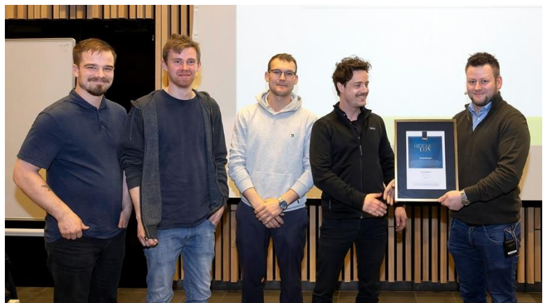
Mynd av umboðum fyri Skatefelagið og formanninum í FUR.

Tey hava megnað at skapt eitt umhvørvi, sum ikki er merkt av sínámillum kapping, men heldur stuðli og stuttleika – og sum kortini er borið av gleði um og virðing fyri teimum, sum av álvara taka seg fram á hesum økinum.