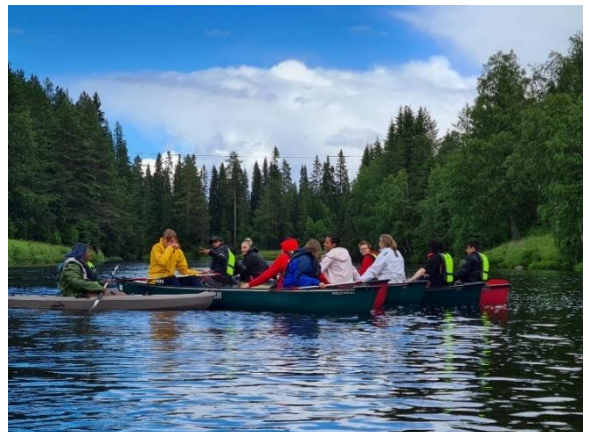
Mynd frá legu hjá BKU í Norra og Blåbandet í Svøríki

Stk. 4. Lokalfeløg, sum søkja, skulu lúka hesar treytir og hava: