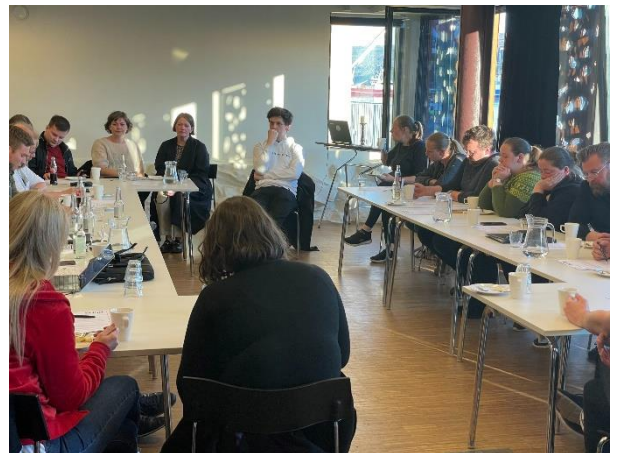
Mynd frá umboðsstjórnarfundinum 2. juni 2022

Seinasta punktið á skránni var arbeiðsbólkur um skattafría upphædd.