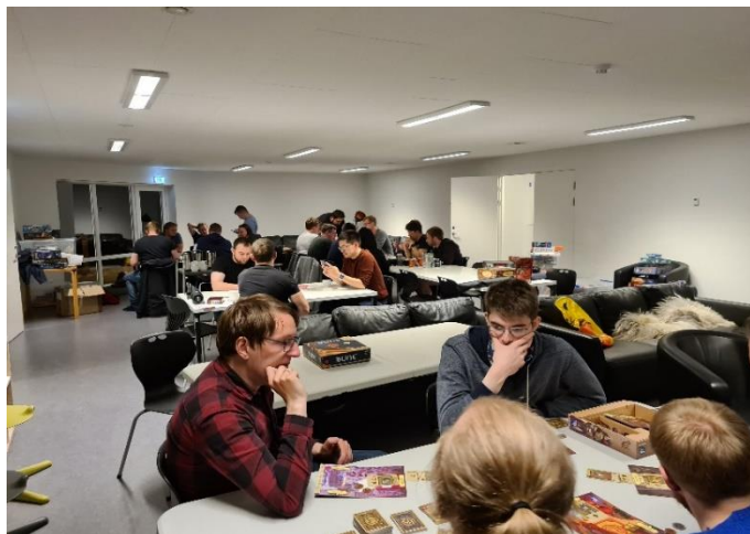
Mynd av Tabletop Føroyar tiltakinum SvínaCon

Stuðul úr Stuðulsgrunni FURs verður býttur so ofta, sum starvsstjórnin heldur tað hóska best. Ongar umsóknarfreistir eru galdandi, og umsóknir koma til viðgerðar og verða svaraðar, so hvørt tær koma inn.