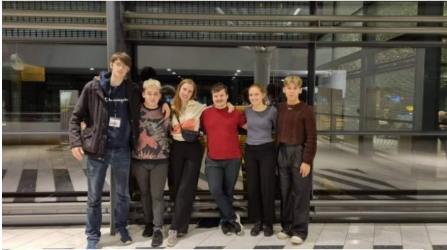
Umboðini, sum luttóku á Ungdómstinginum í Norra.

Á Ungdómstinginum 2022 tóku seks ung úr feløgum í FUR lut.